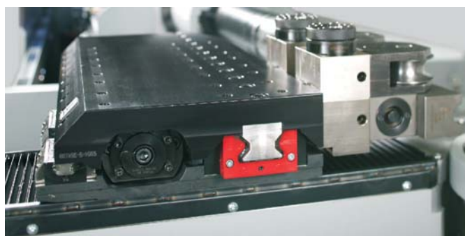
▲ 配备附加导轨的导辊