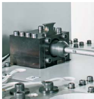
▲ 整个进管过程中，芯轴折弯单元可以自由地编程